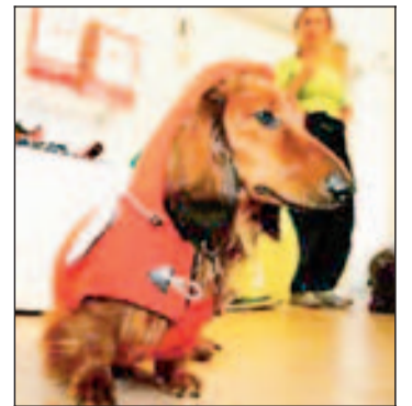
MØTER VENNER: På Lekkerbiskens hundecafé i Oslo.