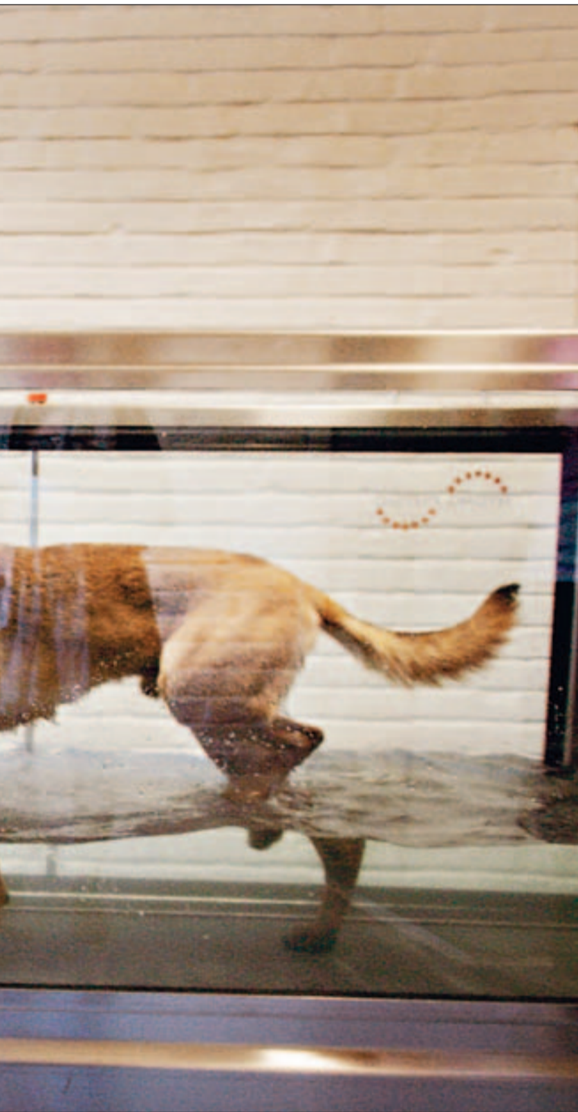
på tredemølle i vann gir kontrollert belastning.